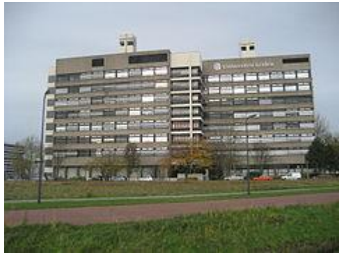
Figuur 4 Sylvius laboratorium (Universiteit van Leiden)

Sylvius kan beschouwd worden als één der grondleggers van de moderne klinische chemie. Hij stelde dat chemische processen een belangrijke rol spelen in het menselijk lichaam en hij zag in dat het onderzoeken van die processen een bijdrage kon leveren aan de kwaliteit van diagnose en therapie. Dit standpunt week behoorlijk af van de geldende opvattingen