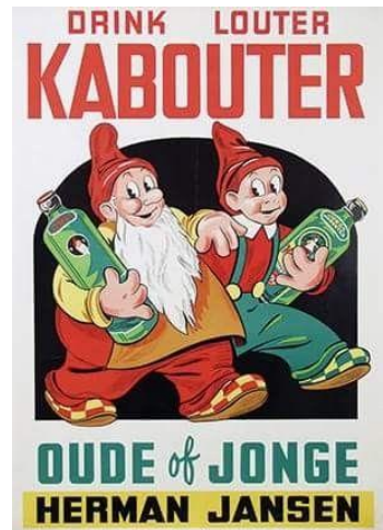
Figuur 5 Oude reclame voor Jenever