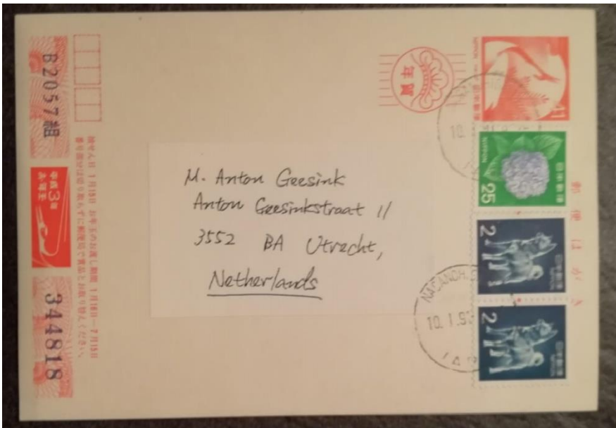
Figuur 2 Japanse kaart aan Anton Geesink adreszijde

In 1990 waren in Japan kaarten te koop, die Japanners aan de leden van het IOC konden sturen met diverse particuliere smeebeden om de volgende Spelen toch vooral aan Nagano toe te wijzen. Deze kaarten waren zelfs verkrijgbaar met het voorgedrukte adres van IOC lid Mr. Anton Geesink te Utrecht. De actie heeft geholpen. Nagano kreeg de Olympische Winterspelen 1998 en de Posthoorn een veilingkavel.