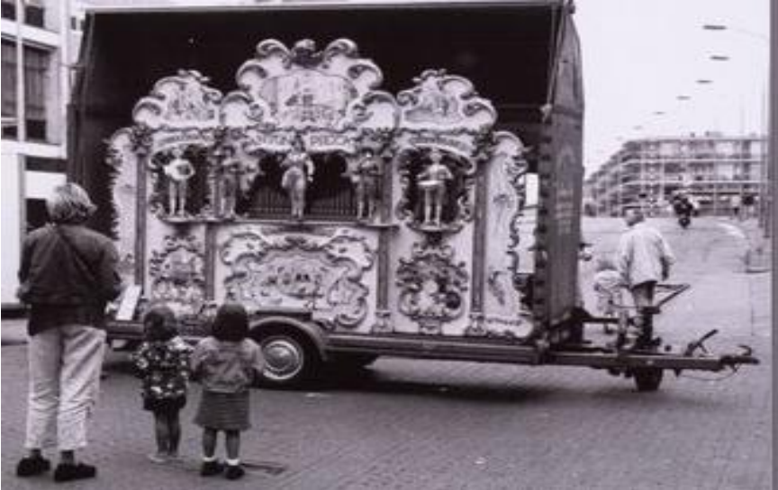
Figuur 6 Draaiorgel Anton Piek op de Gedempte Gracht Zaandam