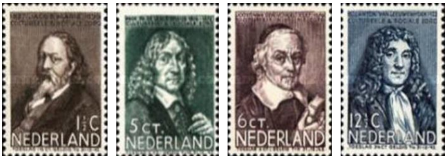
Figuur 3 Zomerzegels Nederland 1937

In het vorige clubblad ben ik gestart met een serie over de zomerzegels van Nederland welke voor het eerst uitkwamen in 1935 en aanvankelijk voornamelijk bekende Nederlandse heren vertoonden. Ik toonde u de 1 e serie uit 1935 met daarop de heren H.D. Guyot (dovendonderwijs); A. Diepenbrock (toonkunstenaar); Prof. F.C. Donders (oogheeskundige) en J.Pzn. Sweelinck (toonkunstenaar). Dat 1 e artikel ging echter over een zegel uit de 2 e serie uit 1936 en behandelde het leven van Monseigneur Dr. H. Schaezman (Nederlands Staatsman). In dit artikel gaan we de 3 e serie die in 1937 uitkwam, onder de loep nemen. Voor de derde keer op rij betreft het 4 heren die veel voor ons land hebben betekend. Jacob Maris (schilder); F. de la Boë Sylvius (geneeskundige); Joost van den Vondel (dichter) en Antonie van Leeuwenhoek (natuurkundige). (zie figuur 4)